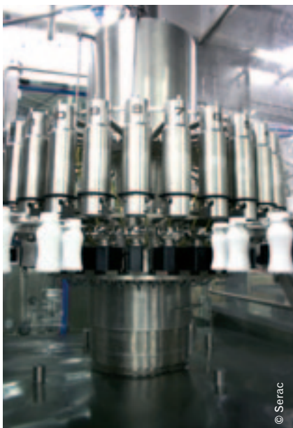
Karuzela rozlewu aseptycznego typu Upfill.

chu powietrza sterylnego. W konstrukcji „Upfill” większość elementów sterujących rozlewem wagowym znajduje się poza strefą aseptyczną. Dzięki temu przestrzeń pod butelkami jest całkowicie wolna, co ułatwia mycie i odkażanie powierzchni maszyny. W przypadku obwodów hydraulicznych i powierzchni urządzenia odbywa się to automatycznie, przed rozpoczęciem produkcji, za pomocą wody przegrzanej o temperaturze 135°C (co odpowiada wymaganiom wszystkich produktów, bez względu na ich