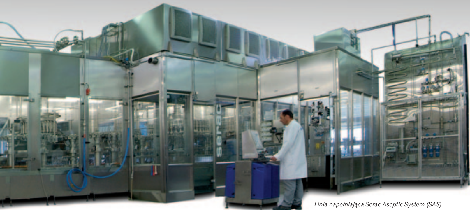
Linia napełniająca Serac Aseptic System (SAS)